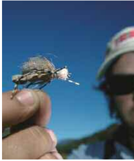
La Fat Albert es una de las moscas más efectivas. En las otras imágenes, pescando distintos escenarios.