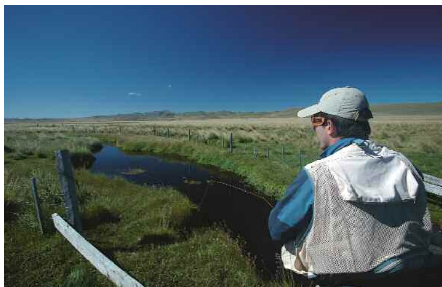
La pesca en charcas como éstas es cuanto menos singular. Arriba un ejemplar conseguido en un sprincreek.

CIENTOS DE TRUCHAS SIN PONERSE LOS WADERS. A la jornada siguiente estuvimos barajando una salida a caballo. El relato de los guías sobre esa excursión nos ponía los dientes largos. Nos hablaba de varios lagos en la montaña, apenas pescados, y con truchas de un tamaño especialmente grande. El pero, una cabalgada de 4 horas ida más otras tantas de vuelta que para un jinete inexperto puede ser más que duro, sobre todo si al día siguiente deseábamos volver a pescar y no quedarnos en cama llenos de rozaduras y agujetas. Aun así, los que montan a caballo dicen que es una experiencia única, y el lugar sorprendente. A cambio optamos por otra de las opciones más interesantes, que consistía en pescar un arroyo de pampa a