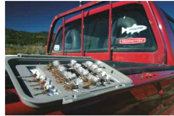
Una selección de tricos para la pesca en superficie. Debajo, una captura con chernobil. Derecha, pescando un arroyo en la estepa o pampa patagónica.